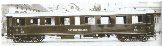
GB B4ü no 510 "Gotthardbahn", grün

FULGUREX wird, wie bereits zuvor angekündigt, zu der bestehenden GB A 3/5 dieses Wagenset (4 Wagen) in hochwertiger Art herstellen, zu öffnende Türen, detaillierte Inneneinrichtung und schaltbare Beleuchtung sind natürlich selbstverständlich. Die Serie ist sehr stark limitiert; es werden nur gerade je Version 12 Set's hergestellt.