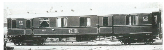
GB FZ4 no 1653 blau

FULGUREX wird, wie bereits zuvor angekündigt, zu der bestehenden GB A 3/5 dieses Wagenset (4 Wagen) in hochwertiger Art herstellen, zu öffnende Türen, detaillierte Inneneinrichtung und schaltbare Beleuchtung sind natürlich selbstverständlich. Die Serie ist sehr stark limitiert; es werden nur gerade je Version 12 Set's hergestellt.