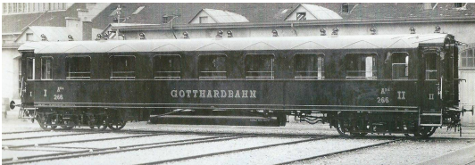
GB AB4ü no 266 "Gotthardbahn", grün