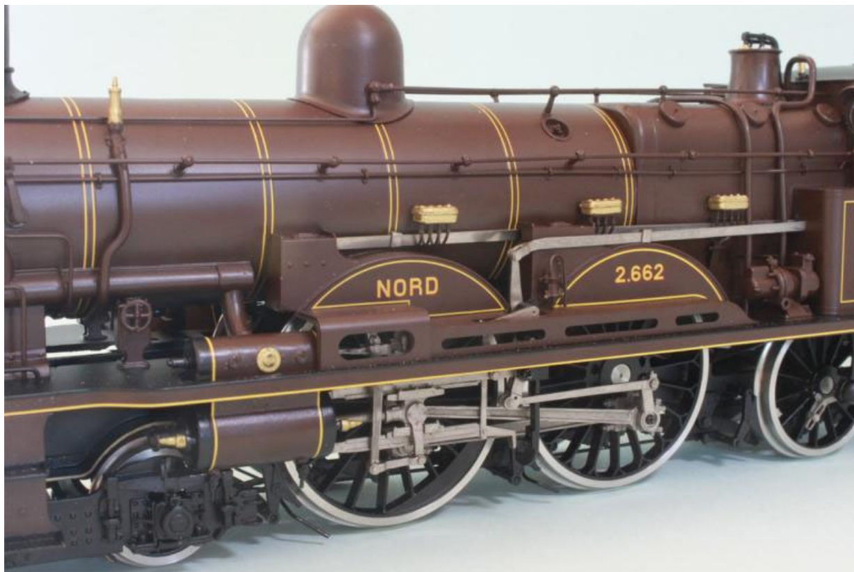
vue détails del la NORD no 2.662 (encore des petites correctures peintures et visserie)

La fabrication des ATLANTIC's 221 est faites; des modèles en écartement "0" (1:43,5); une machine déjà annoncée depuis quelques temps dans nos catalogues - une machine qui manque en modèle réduit en écartement 0. Les modèles sont exécutés, comme d'habitude chez FULGUREX avec un soin et une qualité extraordinaire comme p.ex. aménagement de la cabine, portes ouvrantes, éclairage fonctionnement en digital DCC, sonorisation (décodeur ESU), moteur de précision (dans la machine), etc, etc.... Nous avons choisi des div. machines, div d'époques et compagnie comme suiv. ATTENTION; des nouveaux No.d'article que dans notre catalogue: