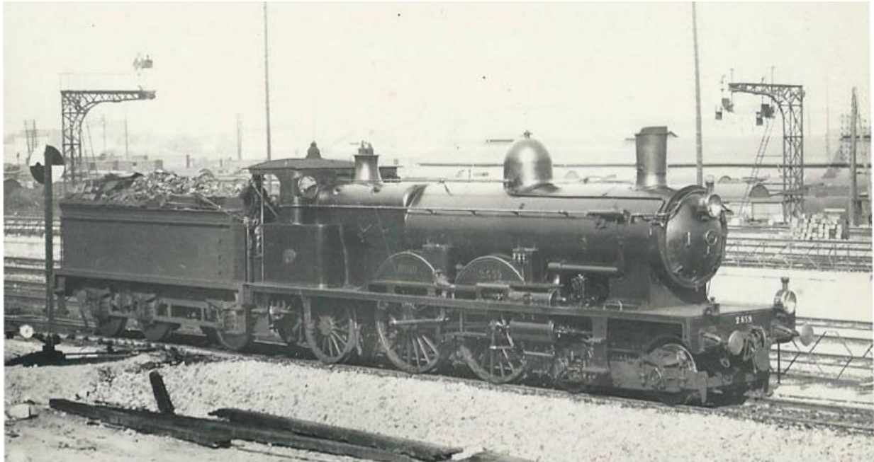
Atlantic NORD 221 no 2.659 dans son état d'origine (env. 1903), notre Art.no.: 2659