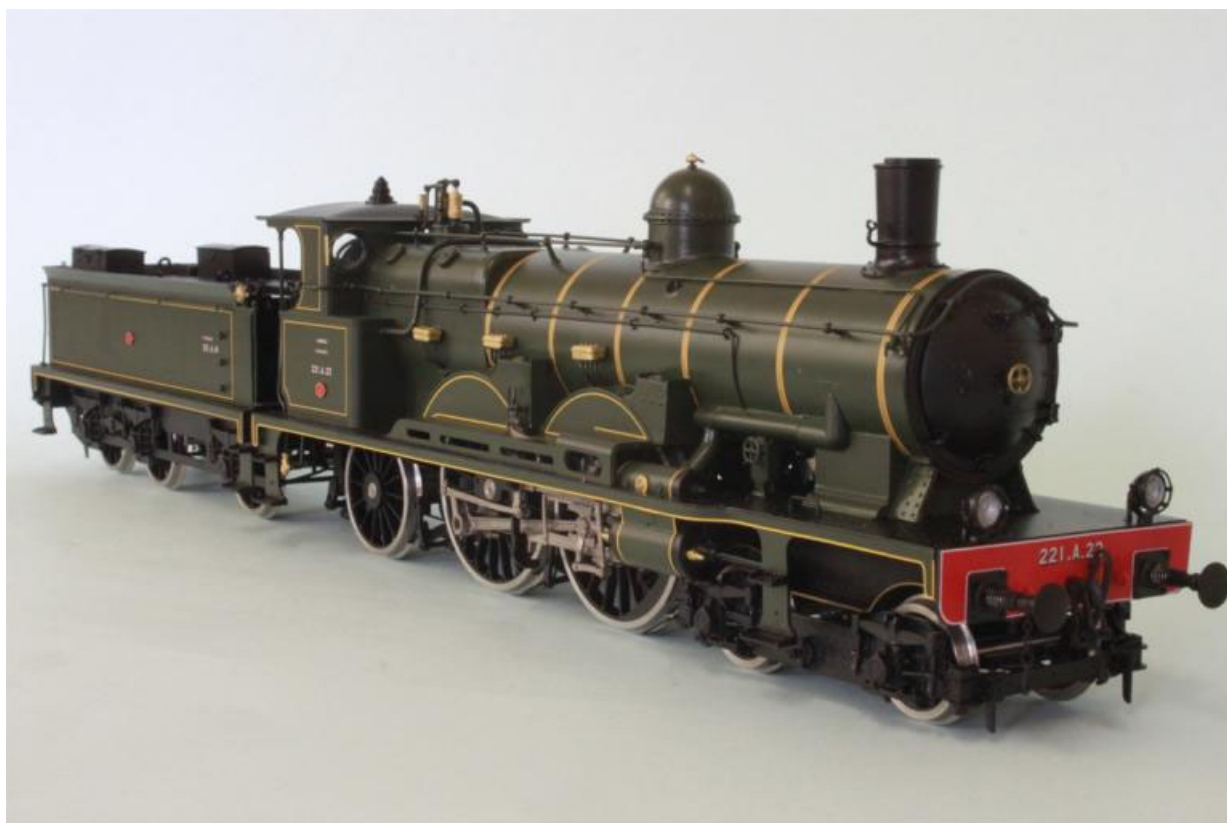
SNCF 221 A 22 "ATLANTIC", (notre Art.no. 2659/7)

En 1938 l'ensemble de ces machines sont toujours en service dans les grandes dépôts du NORD. Elles sont souvent munies de grands tender à bogies de 37m 3 vu l'allongement de leur parcours. Quelques machines sont mis en services par la SNCF.....Le Musée français du Chemin de fer à Mulhouse possède un exemplaire de cette série; la 2.670, qui est magnifiquement restaurée et qui rappelle une des plus belles période de la traction vapeur en France !