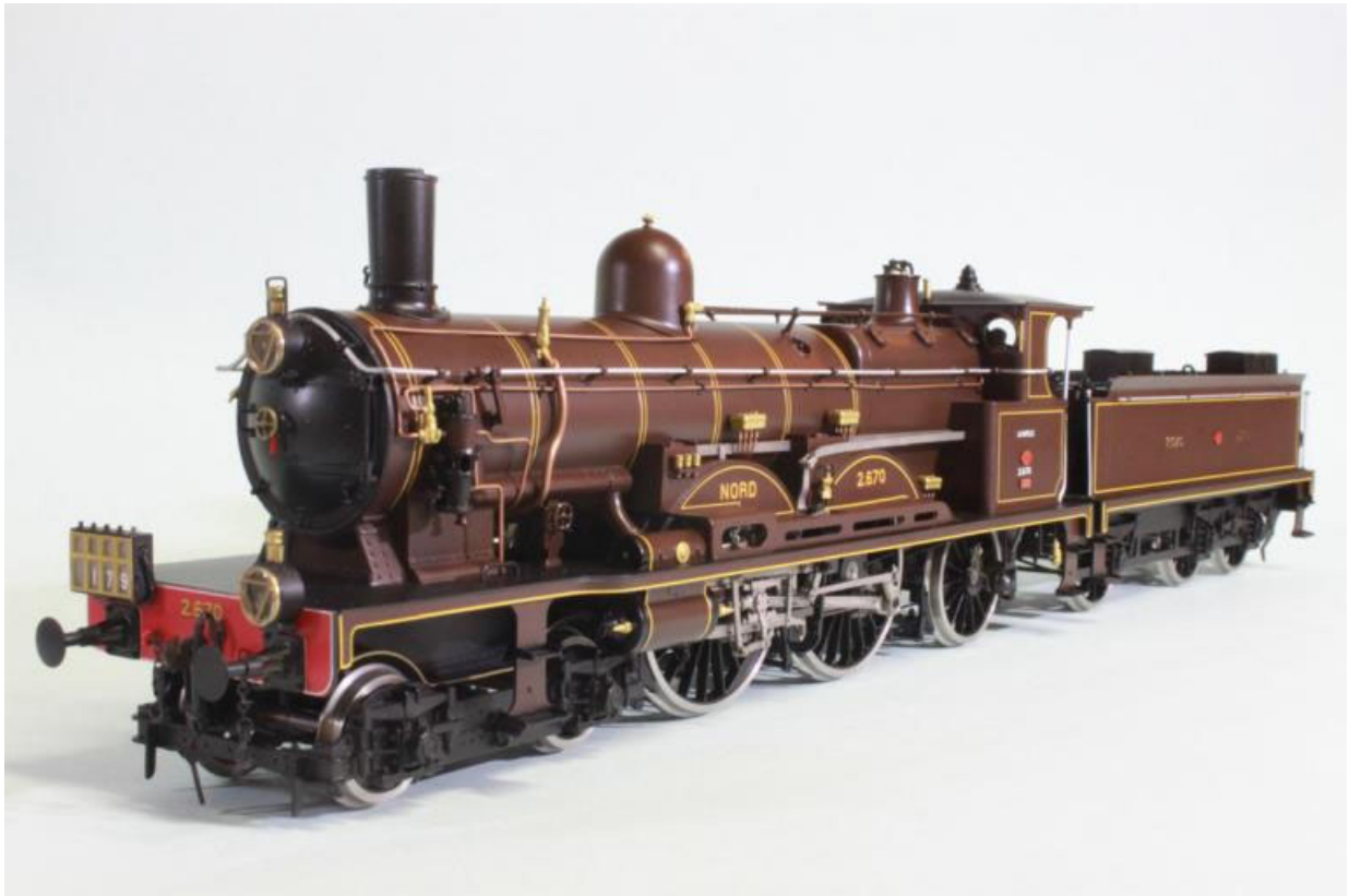
L'Atlantic NORD 221 no 2.670, machine du Musée de Mulhouse (notre Art.no. 2659)

les machines de la série le diamètre passera à 2040mm). Cette machine est dotée d'une élégance simple aux lignes pures et dégagées; le star de cette exposition et l'oeuvre du constructeur Monsieur du Bousquet avec la collaboration de Monsieur de Glehn. La série de cette locomotive donnera naissance à partir de 1902 à une quantité remarquable de 33 machines de vitesse pour la compagnie du NORD.