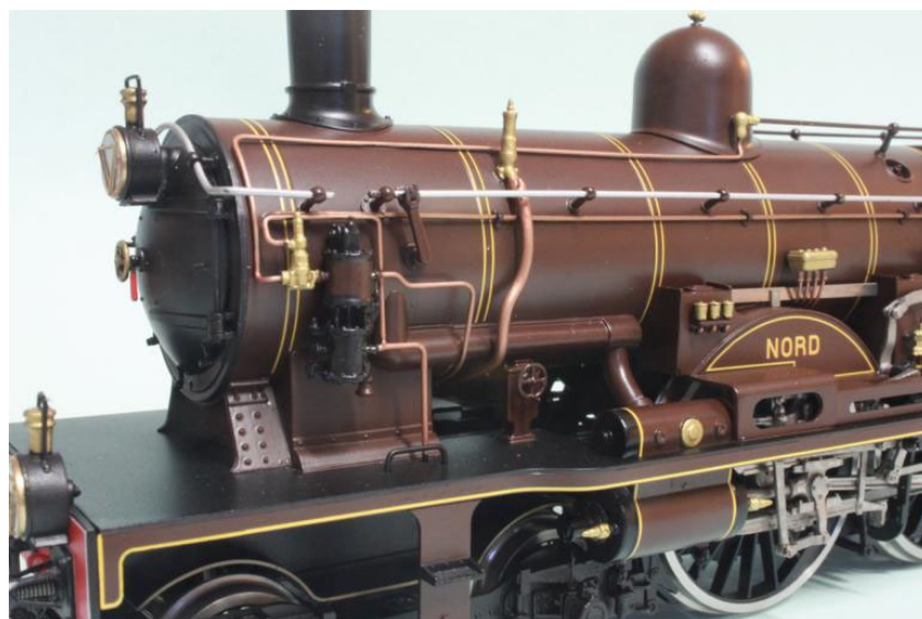
Details Atlantic NORD

Tout d'abord, situons le problème en nous référant à l'automobile, bien connue de tous. Une voiture de course va vite non seulement parce qu'elle a un moteur plus puissant, mais aussi et surtout, parce que ce moteur tourne beaucoup plus vite que celui d'une voiture ordinaire. En outre, le couple moteur d'automobile est plus grand à haut régime qu'à bas régime, ce qui veut dire que le moteur "arrache" plus à haute vitesse qu'au démarrage, ou si l'on veut "répond" mieux. Comme toute machine à vapeur, le moteur d'une locomotive à vapeur ne peut donner qu'un certain nombre de coups à la minute, environ une centaine. Il n'est pas possible, à l'instar des automobiles p.ex., d'augmenter la vitesse en augmentant la puissance et le régime du moteur. Avec un moteur à vapeur, la puissance ne provient que de la chaudière (elle est donc constante et indépendante du régime du moteur), sachant que l'effort de traction (ou le couple moteur) diminue avec la vitesse; une locomotive est très puissante au démarrage et "arrache" facilement son train, mais, au fur et à mesure que la vitesse augmente, l'effort de traction disponible au crochet d'attelage décroît. Pour que la locomotive à vapeur puisse donc rouler de plus en plus vite, la seule solution est d'augmenter le diamètre des roues motrices, exactement comme on a fait pour les "ATLANTIC".