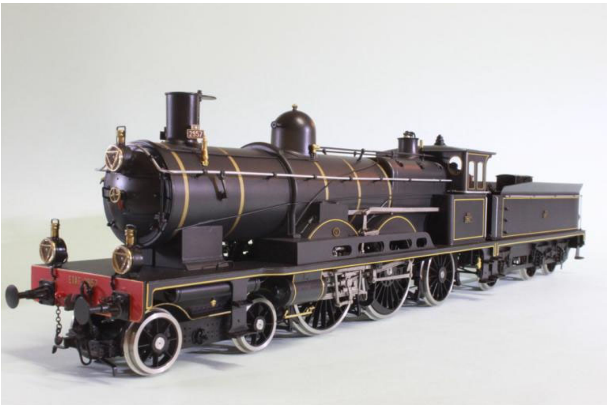
ETAT 221-2957 "Atlantic, avec le tender à 3 essieux d'origine NORD, (notre Art.no.: 2659/6), cette machine est de couleur GRIS/BLEU foncé avec des filets jaune

D'autres pays que la France en firent l'essai: le Great Western anglais avec deux exemplaires qui restèrent en service courant après quelques transformations et plaidèrent pour la pratique du compoundage dans ce pays, ou le réseau américain du Pennsylvania qui fit un essai avec une locomotive. Toutefois, ces essais ne furent pas suivis d'une descendance, la locomotive française ayant trop de différences techniques par rapport aux machines classiques de ces pays.