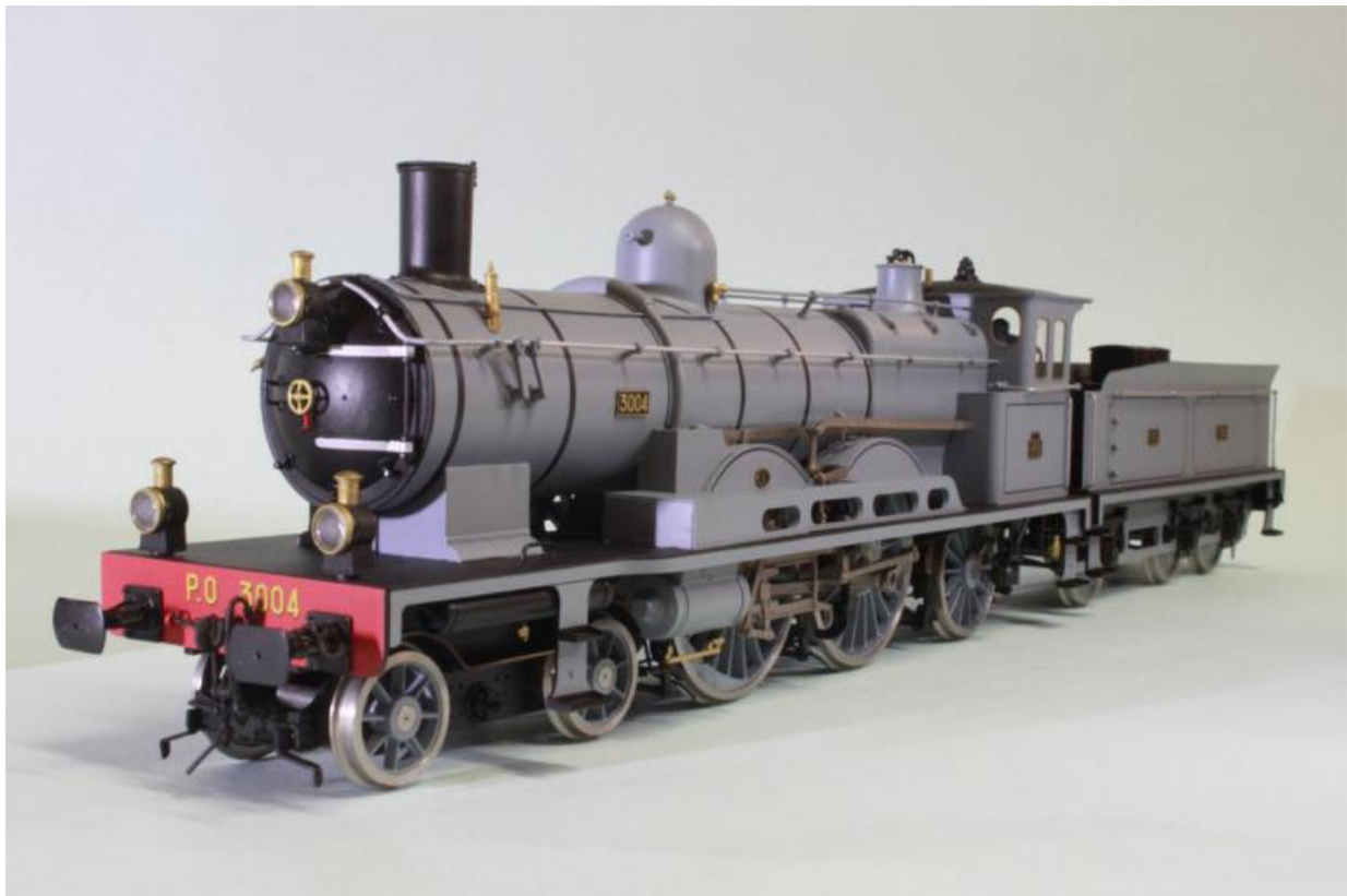
Atlantic PO 221-3004; env. 1910 (notre Art.no.: 2659/4) cette machine est de couleur GRIS avec des filets bleu foncé (cabine fermée)