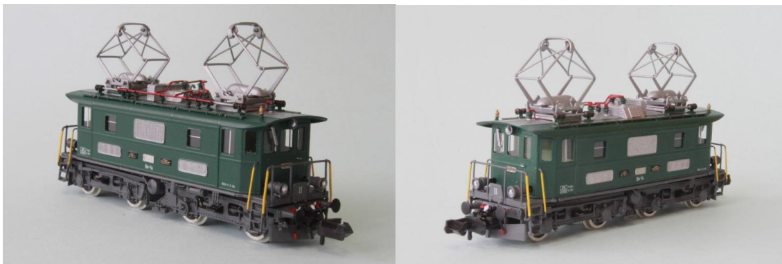
Art.no.: 1161/1 BT Be 4/4 no 11, "Historic", ca. 1994

Unser Modell ist die "historische Lok" in "Moosgrüner" Farbe und in der Ausführung von ca. 1994. REV-Datum: 17.3.1994