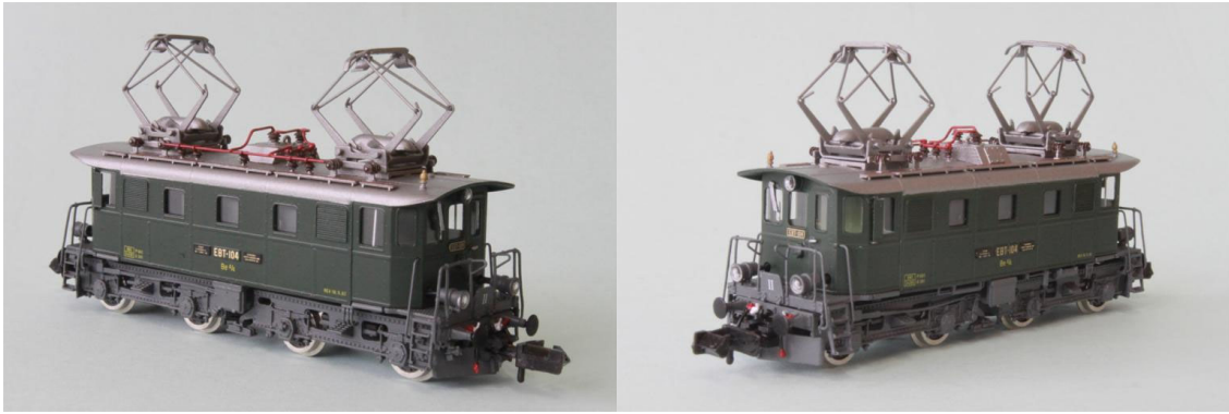
Art.no.: 1162 EBT Be 4/4 no 104, ca. 1963