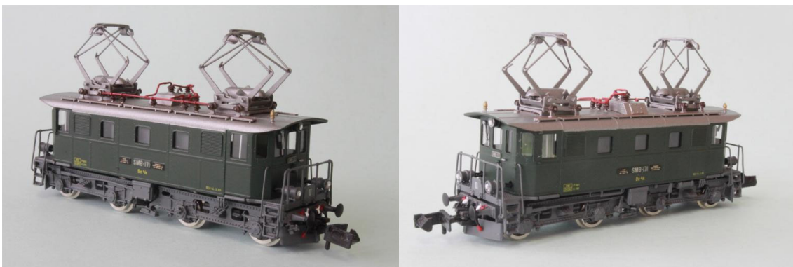
Art.no.: 1163 SMB Be 4/4 no 171, ca. 1966

Die Maschine Be 4/4 no 171 war eine von zwei Loks die von der EBT an die SM abgetreten wurde. Ursprünglich waren dies die no 107 - 108. Ab der Umnummerierung von 1963 wurde aus der no 107 die no 171 (108 zu no 172). Die Lok no 171 war bis um 1997 im regulären Dienst, wurde aber ab 1999 ebenfalls zur historischen Lok und erhielt eine Hauptrevision R3. Die Association SWISSTRAIN konnte die Lok 2006 käuflich erwerben. Sie wird aktuell mietweise vom Verein Dampfbahn Bern für Extrazüge eingesetzt. Unser Modell ist die reguläre Dienstmaschine der SM (Solethurn-Münsterbahn) von ca. 1966. REV-Datum: 14.3.1965