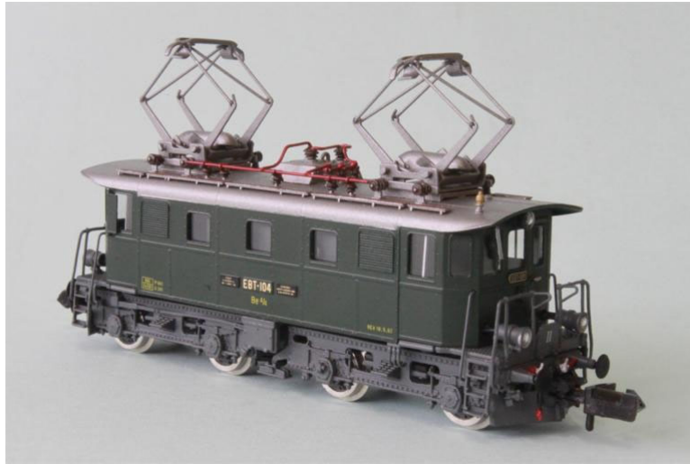
EBT Be 4/4 no 104

Die Modelle werden demnächst zur Auslieferung kommen. Die Unterschiede von BT und EBT / SM Loks sind vorallem die Lüftergitter, Dachaufbauten, Stirnseiten mit Handläufen, Pantos, etc....(bitte beachten Sie auch die untenstehende historische Geschichte jeder einzelnen Lok).