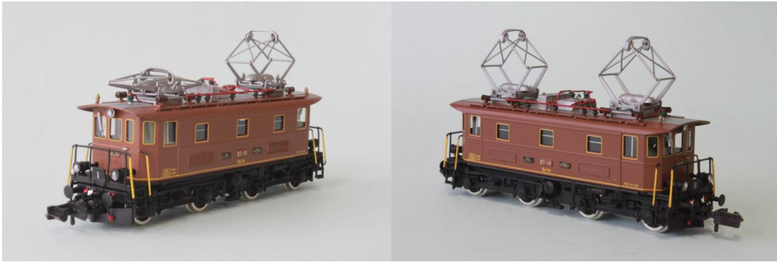
Art.no.: 1161/2 "Oswald-Steam" Be 4/4 no 14, ca. 1989