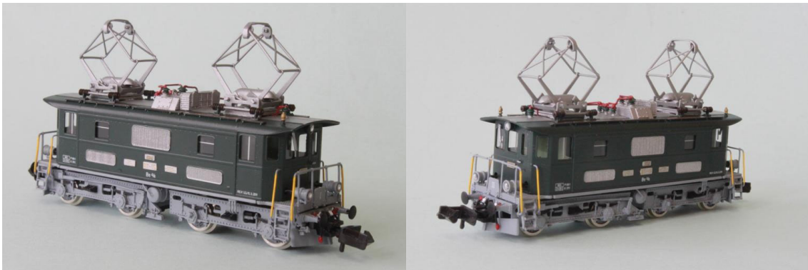
Art.no.: 1161/3 "DVZO" Be 4/4 no 15, ca. 2002

Diese Lok wurde in 1988 von der Dampfbahn-Vereinigung Zürcher-Oberland, kurz DVZO von der BT erworben. Die Maschine befindet sich noch im regulären Dienst-Originalzustand (ausser dem nachbemalten hellgrauem Chassis der älteren Epoche).