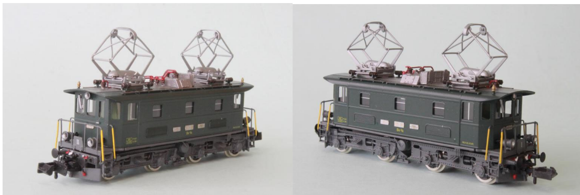
Art.no.: 1161/4 BT Be 4/4 no 16, ca. 1965

Wir wollten unbedingt auch eine Lok der späteren Generation des regulären Dienstes bei der BT. Diese Lok verblieb bis 1988 im Dienste der BT. Im Jahre 1991 wurde die Lok ihrer Fahrmotoren no 3 und 4 beraubt und somit zur Be 3/4 no 16 degradiert. Die Lok wurde ab da zum Rangierdienst in Herisau eingesetzt. Ab 1994 wurde die Lok dann als ausrangiert gemeldet, blieb aber offenbar noch irgendwo hinterstellt. Im März 1997 wurde sie dann, als bis jetzt einzige Lok dieser Serie, abgebrochen. Unser Modell ist die reguläre Dienstmaschine der BT von ca. 1965. REV-Datum: 22.10.1965