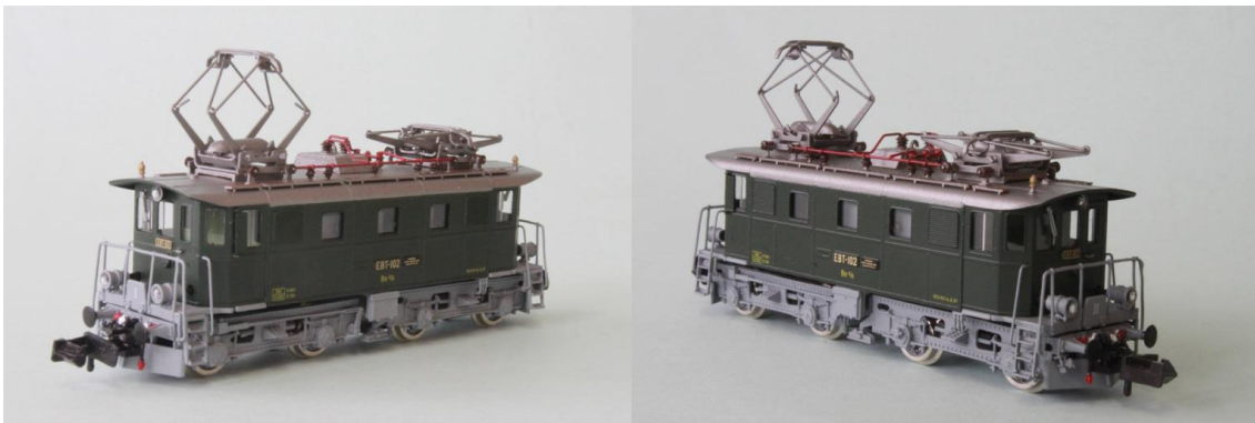
Art.no.: 1162/1 EBT Be 4/4 no 102, "Historic", ca. 1997

Die Lok no 102 wurde ab 1997 zum historischen Triebfahrzeug erklärt. Die Maschine bekam wieder ein hellgraues Chassis und ein silbernes Dach. Nach der Fusion der BLS Lötschberg-Bahn kam sie 2006 in den Bestand der BLS, welche sie dann in die BLS Stiftung überführte. Dort wird sie als historisches Erbe der BLS gepflegt. Die Maschine ist noch voll betriebsfähig und wird für Sonderfahrten eingesetzt. Unser Modell ist die historische Version mit dem hellgrau Chassis. REV-Datum: R3 14.6.1997