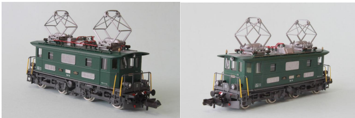
Art.no.: 1161/1 BT Be 4/4 no 11, "Historic", ca. 1994

Unser Modell ist die "historische Lok" in "Moosgrüner" Farbe und in der Ausführung von ca. 1994. REV-Datum: 17.3.1994