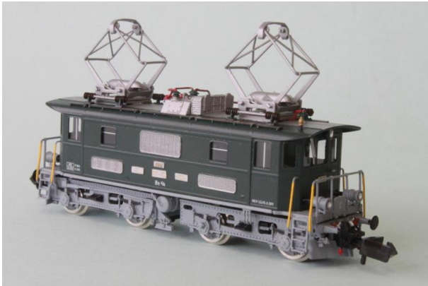
Art.no.: 1161/3 "DVZO" Be 4/4 no 15, env. / ca. 2002

BT Be 4/4 no 15, Art.no.: 1161/3 digital - 2 pces / Art.no.: 1161/3 analog - 1 pce