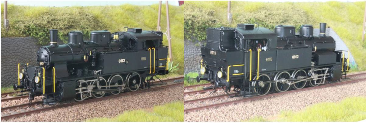
Art.no.: 2254/7 SBB/CFF E 4/4 no 8913