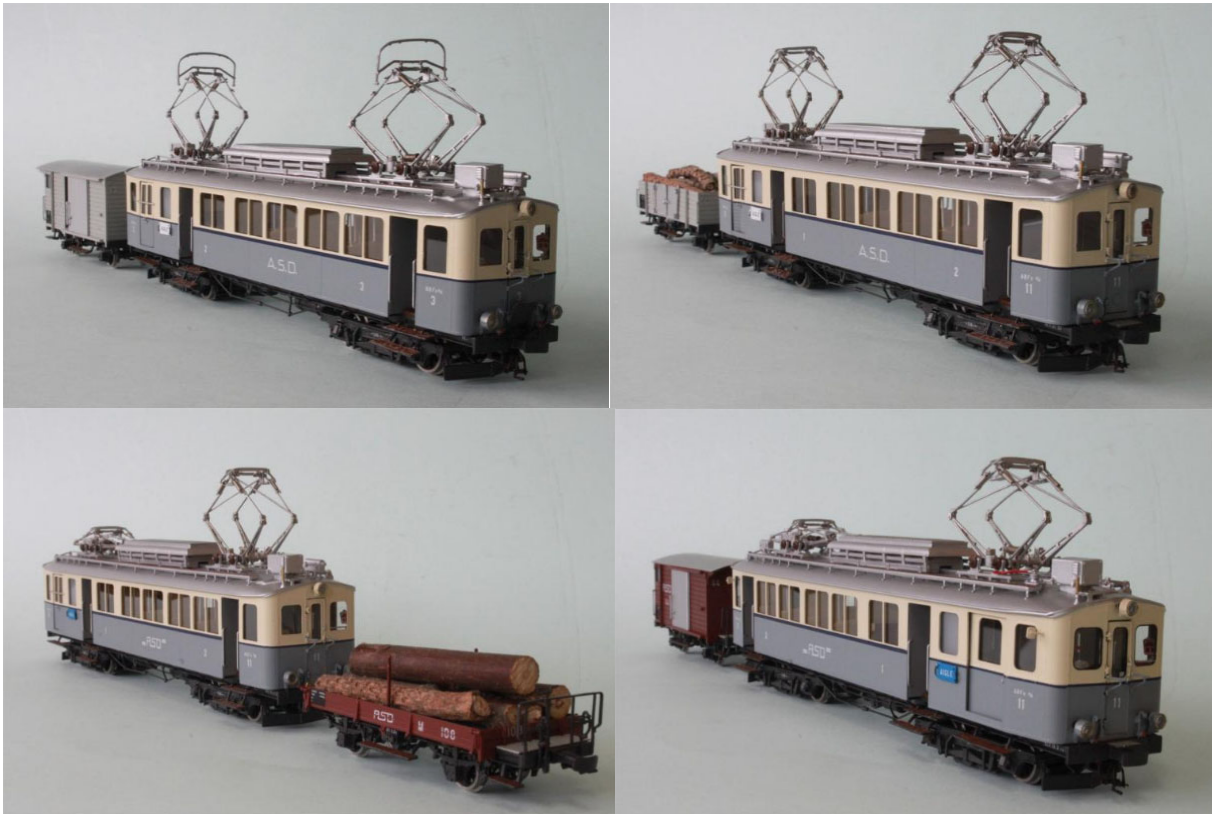
ASD Sets no 7 - 10, encore 4 set's livrable / noch 4 Set's an Lager

ASD ABFe 4/4 no 11, neues Logo ASD, Schiebetüre, mit Wagen typ "K", Set.no. 10