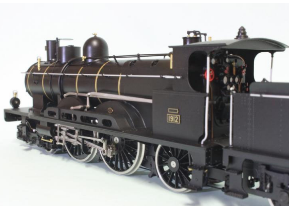
MIDI 221-1912 Atlantic, 2 domes, simple compressor, digital/sound, Art.no.: 2659/5 encore 1 pce livrable MIDI 221-1912 Atlantic, 2 Dome, single Kompressor, digital/sound, Art.no.: 2659/5 noch 1 Stück lieferbar