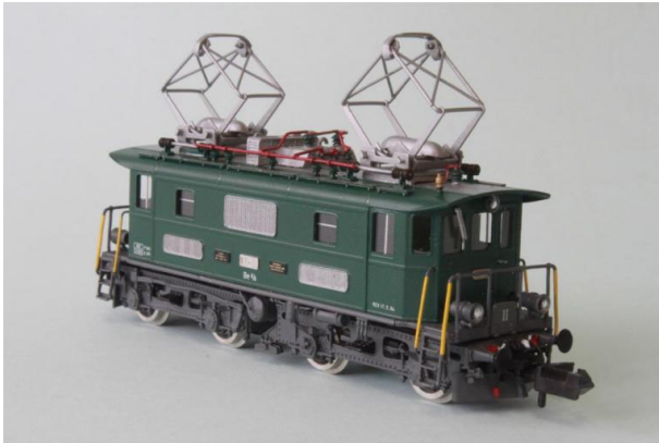
Art.no.: 1161/1 BT Be 4/4 no 11, "Historic", env. / ca. 1994

BT Be 4/4 no 11, Art.no.: 1161/1 digital - 2 pces / Art.no.: 1161/1 analog - 1 pce