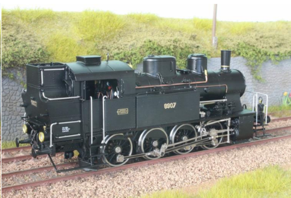
Art.no.: 2254/4 SBB/CFF E 4/4 no 8907

SBB/CFF E 4/4 no 8913 "Basel", Art.no.: 2254/7, digital - 1 pce