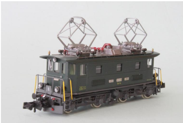
Art.no.: 1161/4 BT Be 4/4 no 16, ca. 1965

BT Be 4/4 no 16, Art.no.: 1161/4 digital - 1 pce / Art.no.: 1161/4 analog - 1 pce