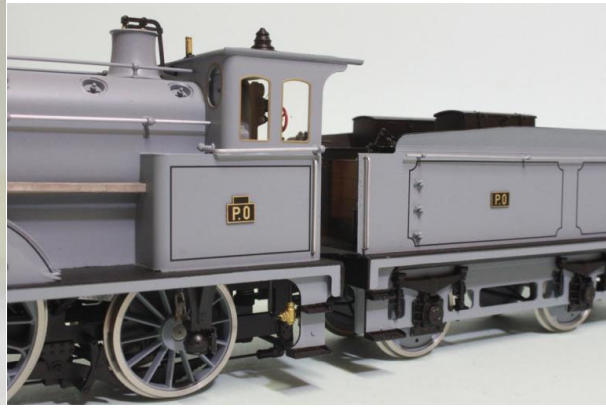
PO 221-3004 Atlantic, "Sud Express", grande cabine, digital/sound, Art.no.: 2659/4 encore 1 pce livrable PO 221-3004 Atlantic, "Süd Express", grosse Kabine, digital/sound, Art.no.: 2659/4 noch 1 Stück lieferbar

MIDI 221 no 1912 Atlantic, 2 domes, Art.no.: 2659/5 digital/sound - 1 pce