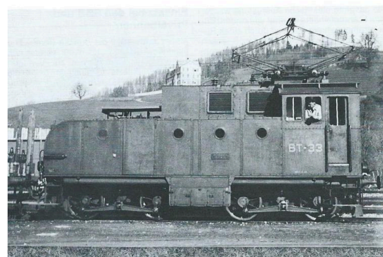
BT Ce 4/4 no 33